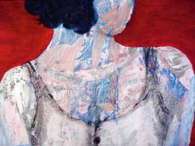
Detail van bewerkte gessodruk van Hanneke Barendregt